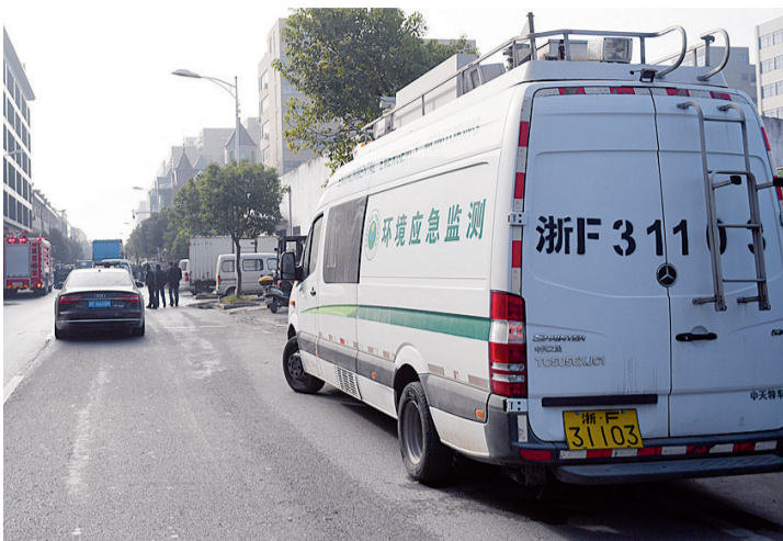
环保部门对现场进行环境监测