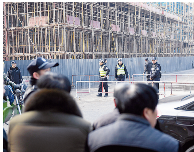
民警在厂区外维持秩序