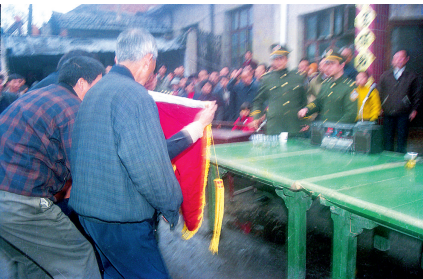
当年凶杀案告破后,家属送来锦旗