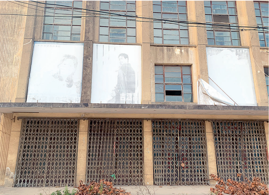
影院的宣传海报早已褪色