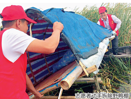
志愿者动手拆除野鸭棚

2016年底,徐瑞金欣喜地发现,第一次有候鸟停留在江海湿地过冬了。同年,杭州首个边防派出所临江派出所成立,江海湿地被划分给临江派出所管理,这为湿地管理增添了不少警力。