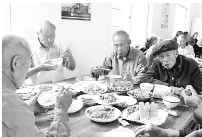
80岁以上老人可享免费午餐