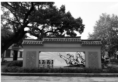
勤俭村的农民哲学

能架错墙”,在勤俭村每走几步,就能看到一幅幅手绘哲学墙画。这些哲学道理通过漫画的形式,图文并茂地展现在勤俭村30余户村民家的外墙上,成为当地一道美丽的哲学文化风景线,也在潜移默化中将哲学理念渗透到每位村民心中。