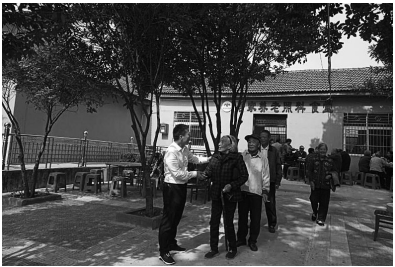
居家养老照料食堂关爱老年人

烧菜做饭是每家每户的日常之一,但对很多农村的独居老人、留守儿童来说,吃上暖心饭、放心菜,却成为他们的一大难事。新塘边镇毛村山头村打造的居家养老服务中心,切实地解决了老人、留守儿童的吃饭难题。