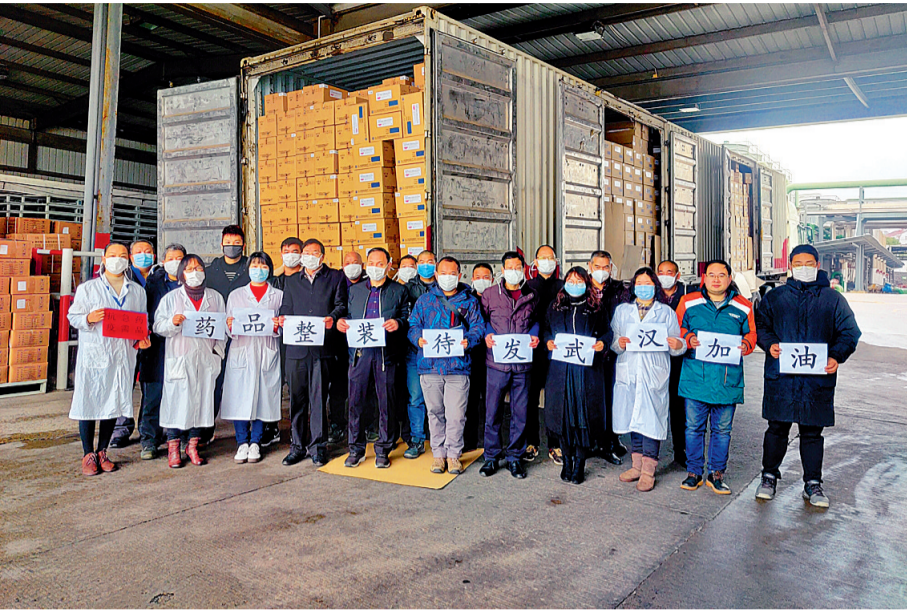
支援药品发往疫区