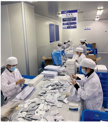
加班加点赶制药品

“必须保质保时保量完成药品生产!”这声命令掷地有声。此后,公司迅速启动应急预案,紧急召回春节已放假的新、嵊两地员工,以及其他口服固体制剂车间员工,一起加班加点,确保药品能保质、保量、按时完工,并要求制剂设备科等辅助部门积极配合,保证以最快速度生产出药品,紧急供应到抗击疫情的一线。“好的”“没问题”“只要疫区需要,只要国家需要,我们会回来”……接到加班通知后,公司的采购、质检、仓储、销售、物流等部门员工也放弃了春节假期休息时间,于1月22日开始,加班加点,与时间赛跑,全力以赴。原本打算带着孩子回老家内蒙古过年