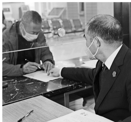
诉讼服务中心恢复开放,确保防疫办案两不误

120件,在线调解88件,在线送达1928件,调撤结案案件461件,通过网络查控被执行人财产信息21875次,接听并处理12368司法服务热线1046次。2月抗击疫情期间,婺城区法院结案数位居金华市第一、全省第二,实现了防控不懈怠、办案不掉链。