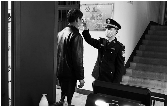
做好法庭的安全防护