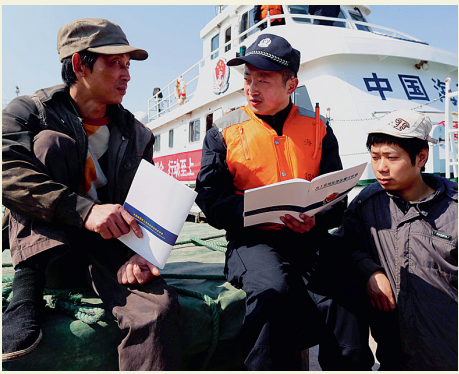
海警向渔船民宣讲海上常用法律法规

在这里,你可以品尝到美味的梭子蟹、海鱼,可以在周末去附近的海岛游玩,还可以在傍晚时分看一场海上落日……2019年,舟山市普陀区蝉联中国最具幸福感城市称号,群众安全感满意率达99.11%,居全市第一。 普陀人的幸福感源自哪里?近两年,普陀区围绕“高水平建设开放活力的幸福普陀”总目标,以开放创新为核、富民安民为本,围绕经济建设、生态环境、施政效能、社会治理、民生福祉等持续发力,不断绘制、完善着“幸福地图”。