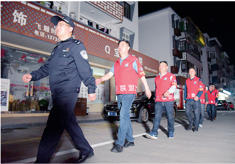
展茅五大平安联盟之村社联盟

这些只是普陀区构筑社会基础平安网络的一部分。近年来,普陀还依托兼合式党支部平台,积极培育“网格四大员”“渔嫂禁毒队”“军警民联防”“物业+治安管家”“双色马甲”等群防群治品牌,在机制上逐步推进网格化管理力量与基层社区自治力量的有机融合,切实发挥基层多元自治力量的互补作用。