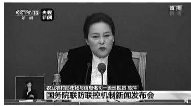
国务院联防联控机制新闻发布会

4月19日,国务院联防联控机制发布会上,农业农村相关负责人介绍:“近期,央视为湖北带货受到广泛关注,央视主播朱广权和网络直播红人李佳琦的带货效果非常明