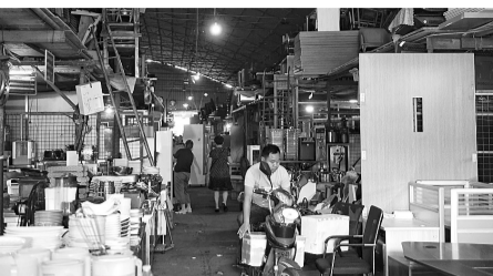
疏散通道被占用、堵塞