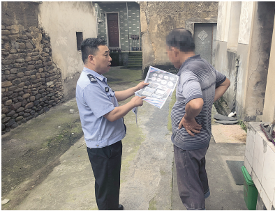
民警走街串巷找失主