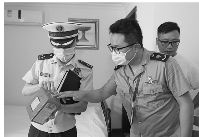
防烟面罩的封条被撕毁