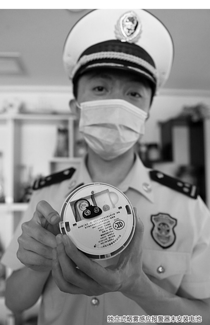
独立式烟雾感应报警器未安装电池