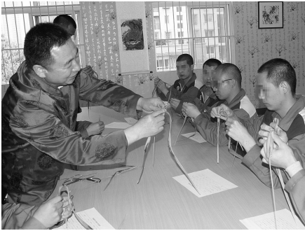
戒毒人员正在学习棕编技艺

品”的特色戒毒文化;同时,通过定期开展技能大赛,在全所营造“学艺定心”的技能教育氛围,助力戒毒人员出所后更好地就业和生活。