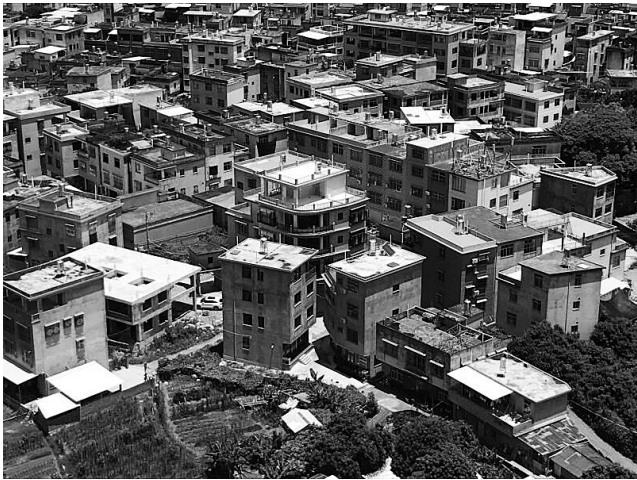
犯罪团伙隐藏在村宅里

本报讯 随着列车进站,前来迎接的警车载着专案组民警和10名犯罪嫌疑人从嘉善南站驶出。至此,嘉善县警方破获了该县首起跨境网络赌博案件,涉案资金流水高达6000余万元,团伙上层成员非法获利500余万元。 今年5月中旬,姚庄派出所所在工作中通过网络线索,发现了一个利用微信小程序跳转到名为“新苍穹娱乐城”的境外网络赌博平台。经过扩展线索来源、深挖细查,又发现了一个名为“星际娱乐城”的同类网络赌博平台。 这两个平台的技术人员均将服务器架设在境外,同时在境内招收人员经