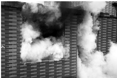
悬挂式干粉灭火装置爆裂瞬间