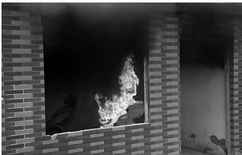
电动车处于猛烈燃烧状态