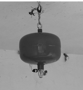
悬挂式干粉灭火装置