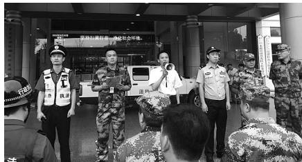
集中开展大规模大清查

展“大会战”法律知识宣传和咨询活动,通过开办“法律知识进村社”大讲堂,提高村民的法律意识和防诈骗意识。