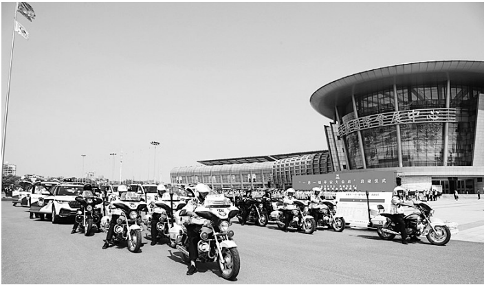
保一方平安,建平安园区