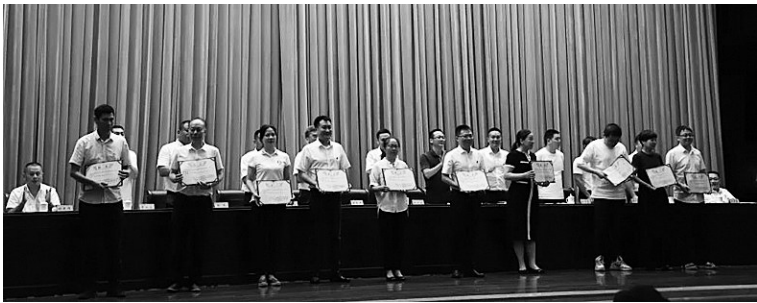
聘任人大代表、政协委员担任“平安园区监督员”

久、问题最多、改造最难、影响最广的小微园,需要拆迁安置的企业有48户113家,涉及用地类别多样、产业集聚单一、基础配套落后、环境污染严重、权属权限模糊、规划水平低端、利益纠纷复杂等问题。