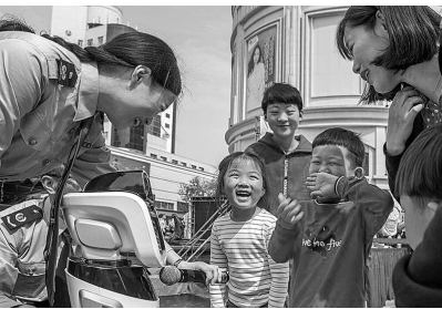
“小西”机器人普及税法

制定出台《关于全面推进领导班子会议学法的实施方案》,市领导带头每月学法。全面开展公务员年度学法考试、任前考法、年终述法等。联合实施全市公务员“学法用法三年轮训行动”。