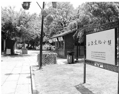
南关厢“法治文化小镇”

编制实施《海宁市法治文化阵地示范群规划》,打造海宁特色“七彩”法治文化示范带,被《法制日报》《浙江日报》等权威媒体专题报道。全国首个法治文化小镇——南关厢“法治文化小镇”、全省较具规模的法治文化主题园——沁德园等3个基地荣获浙江省法治宣传教育基地荣誉称号。已建成市镇村组级法治文化示范阵地100多个。结合“书香城市”建设,建成首批法治“共享书屋”15个,市民借阅达10000多次。