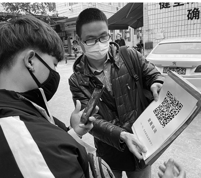
云南昭通盐津火车站法治宣传

海宁市围绕核心、贴近中心开展普法工作,部署推进“防控疫情 法治同行”、《浙江省民营企业发展促进条例》集中宣传等专项行动,助力依法防控疫情,保障企业复工复产。贯彻落实东西部扶贫协作和对口支援工作精神,创新实施“法润黑水”帮扶工程,开展“送法进藏区”活动。通过成立法律服务团上门宣讲法律政策,制播“法宝”方言话中心系列专题节目,设置大型户外公益广告,努力做到党委政府中心工作推进到哪里,法治宣传教育就跟进到哪里。