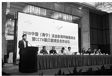
中国(海宁)法治影视剧制播峰会