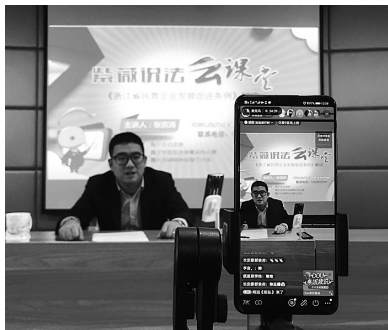
“紫薇说法·云课堂”开展抖音直播,在线答疑助力企业复工复产

利用报纸、网站、微博微信、广播电视、户外频媒等全方位载体,开设《紫薇说法》《潮乡卫士》等特色普法品牌栏目。以“空中访谈”、微课录播、热线答疑等形式,打造“紫薇说法·云课堂”,实现法律资讯和法律服务“云共享”。探索抖音普法,通过“网络直播+互动答疑”“网络带货+志愿普法”等方式,提升普法精准度,被《法制日报》、浙江新闻客户端等媒体报道。以法治文化主题园——沁德园为原型,打造VR全景,并结合春节元宵猜灯谜等传统民俗文化,开展微信“法智”灯谜、VR游园集五福等活动,吸引近10万人次参与。