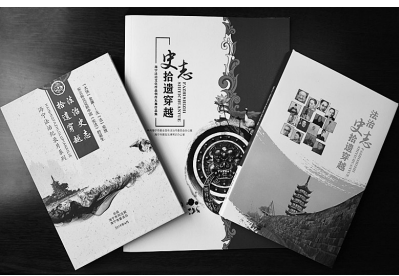
从左至右:海宁法治纪录片系列、法治文艺创作大赛作品集、法治文化典故集锦

在全省率先出台实施《海宁市关于高水平推进法治文化建设实施意见》。联合举办“法治史志·拾遗穿越”征文和文艺创作大赛,专题挖掘法治人物、法治典故等本土法治文化资源,并以此为原型,用非遗等传统文化演绎法治传奇,共征集民间工艺品、地方戏曲、法治书画近300件。坚持“法治+旅游”思路,出台《关于开展法治文化研学旅行工作的意见》,统筹全市法治教育、文化旅游等资源和各类实践基地,全省率先开展法治文化研学旅行。