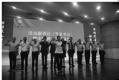
海宁市法治型党组织建设推进会上法治副书记(平安书记)集中受聘、履职承诺

近年来,海宁市高水平推进民主法治村(社区)建设,截至目前,已成功创建国家级民主法治村(社区)4个、省级民主法治村(社区)38个。全省率先建设法治型党组织,149名法治副书记以“一对一”或“一对多”的形式覆盖所有村社区及部分商圈楼宇,有效推进党组织领导基层治理法治化。该做法已入围第五届全国基层党建创新典型案例征集评选活动复评,成为全国1300多个案例中入选的200个案例之一。