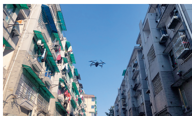
街道社区借助无人机助力疫情防控和复工复产

市委、市政府所在地，辖区内有火车站、杭州客运中心等多个人流密集场所，还有各类专业市场50多家，流动人口达62万。