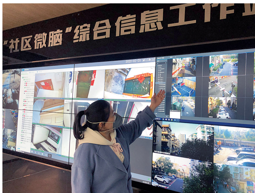
社区微脑发挥一线统筹调度作用

与此同时，江干区在“四平台”信息系统上增加“疫情防控”类问题上报流转处置功能，系统下设疫情信息、复