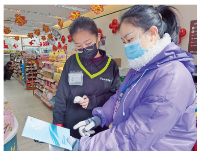
江干区网格工作人员为辖区商家发放蓝皮手册 做到疫情防控和复工复产两不误