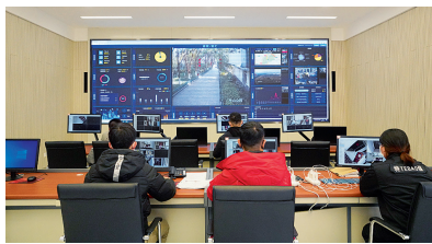
半山街道望宸·智汇“街道小脑”平台

街道实现了疫情防控“前端精准发现+线下温情处置”。“我们对居家隔离人员小区易集聚点、独居老人等区域，通过无线联网，实现24小时监管全覆盖。监控画面若发生变化，平台会自动报警，工作人员即通过远程呼叫或群内联系，及时处置事件。”街道相关负责人介绍说。