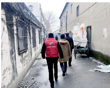
平安志愿者参加网格大排查

新冠病毒危不危险？危险！抗疫上不上？上！为了守好“自家门”、看好“自家人”，网格团队携手逆行。