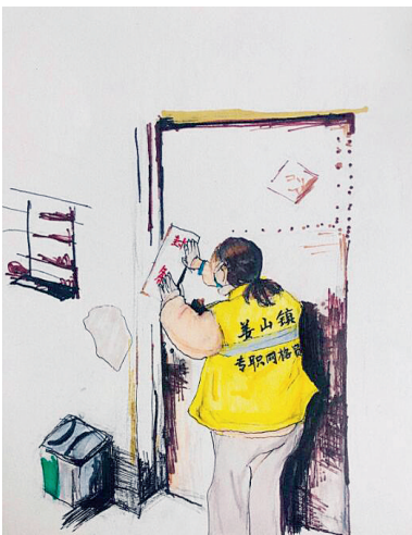
专职网格员贴防疫封条

他们到村组、进社区、入楼栋、守卡口，始终奋战在疫情防控一线，构筑起抗击疫情的坚强堡垒。