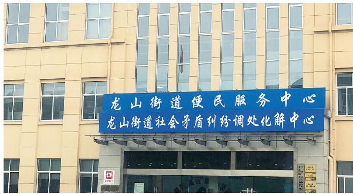
社会矛盾纠纷调处化解中心

盾纠纷调处化解中心的劳动争议调解委员会、物业家事品牌工作室、旅游纠纷调解室、杨梅纠纷调解委员会等调委会组织，也在化解各类纠纷中发挥了重要作用。