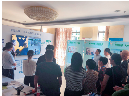
未来社区服务平台

如果说，智能门锁让居民“安心住”，那“智慧消防”系统则为此加上了“双保险”。近日，在龙山街道高山岭居民区，街道安监中