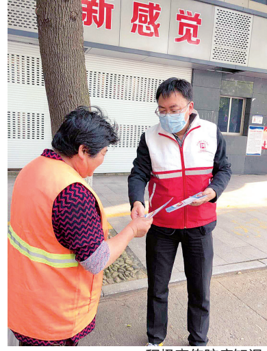
积极宣传防疫知识

一声令下，全员到齐！在这场没有硝烟的战斗里，嵊州市网格员们齐心协力筑起“钢铁长城”。他们全员投身抗疫一线，联防联控，充分发挥“一中心四平台一网格”的机制作用，严把防疫关，倾心为人民。