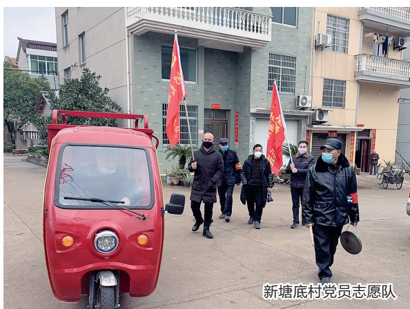
新塘底村党员志愿队