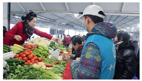
网格为群众买菜送菜

以“群”汇聚合力，筑牢全民战“疫”防线，普陀区正是这么做的。除了网格员，普陀区还广泛动员平安志愿者、新居民义工队等自治组织，组建防控应急队、生活保障队、关爱疏导队、党员宣传队等服务队伍，积极营造群防群控的良好氛围。