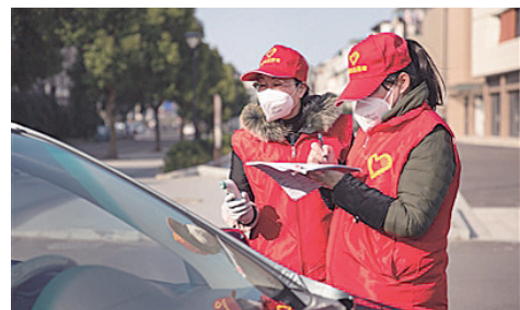
做好出入排查工作

同时，针对疫情防控和复工复产的需要，六横社会治理与政务服务中心的港航、边检、海关、海事、公安等各类职能部门窗口，实现多部门实时联动，重点为外来流动人口、外籍船员、外籍船舶办理入舟审批工作，牢牢守住疫情防控“第一防线”，全力助推企业复工复产。