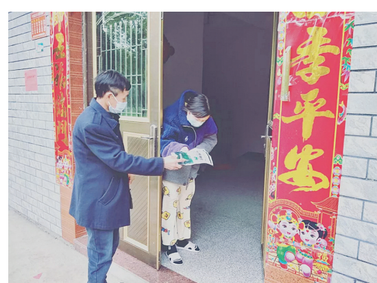
网格员挨家挨户宣传防疫知识