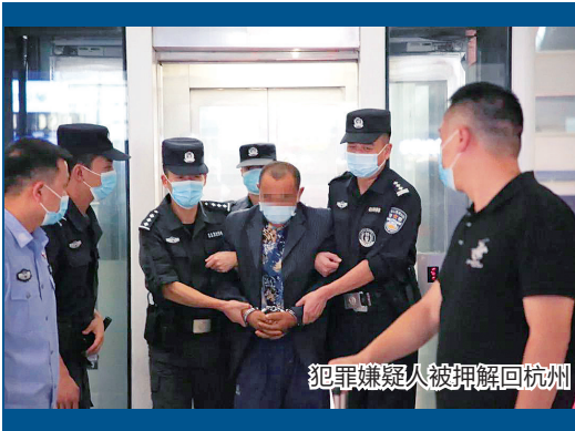
犯罪嫌疑人被押解回杭州