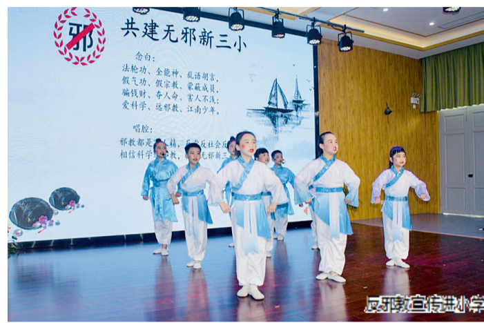
反邪教宣传进校园