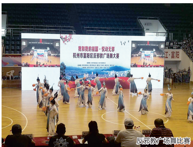
反邪教广场舞比赛