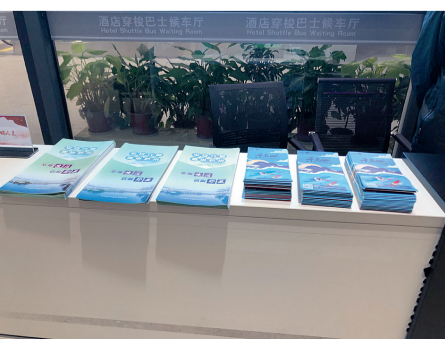
穿梭巴士成滚动反邪阵地

目前,杭州共建成23大类226个反邪教警示教育阵地,反邪教常识知晓率城市居民升至85%、农村群众升至75%。