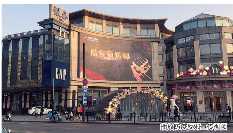
播放防疫反邪宣传视频