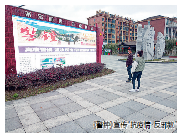
“警钟”宣传“抗疫情 反邪教”

推进反邪教工作,离不开从事理论与实践工作的专家学者、行家里手共同深化研究。今年8月,在杭州市委政法委、市反邪教协会联合举办的市域社会治理现代化与新时代反邪教工作理论成果交流会上,来自全市13个区、县(市)委政法委、反邪教协会、市直各相关部门以及市属高校等各行业代表等200余人,深入探讨了新时代反邪教工作经验和理论研究成果。