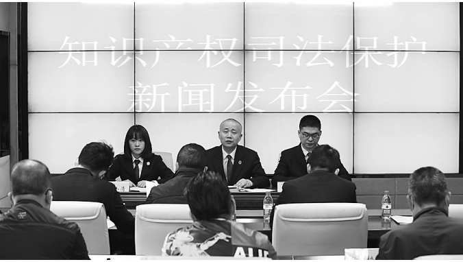
瑞安法院召开发布会,率全省之先出台《关于向社会公布知识产权严重侵权企业名录的规定》