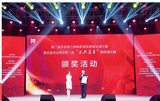
微党课《痛与爱》讲述青年一代的忠诚担当

10月22日晚,星光熠熠的颁奖晚会现场,重温这一堂堂各具特色的微党课,在场所有聆听者的心绪再一次被叩动。