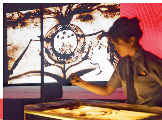
沙画画出抗疫赞歌