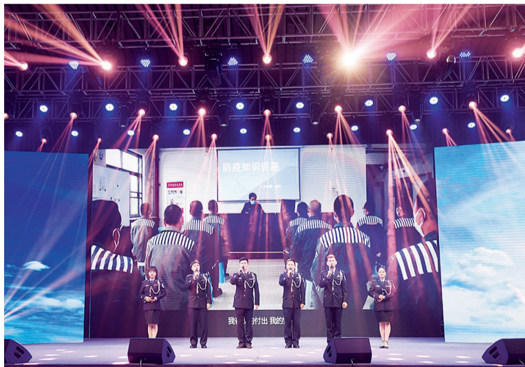
大墙内的战“疫”故事打动人心