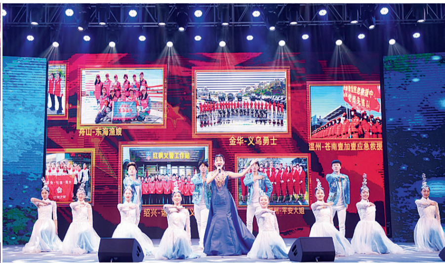
赞歌献给战“疫”中的平凡英雄