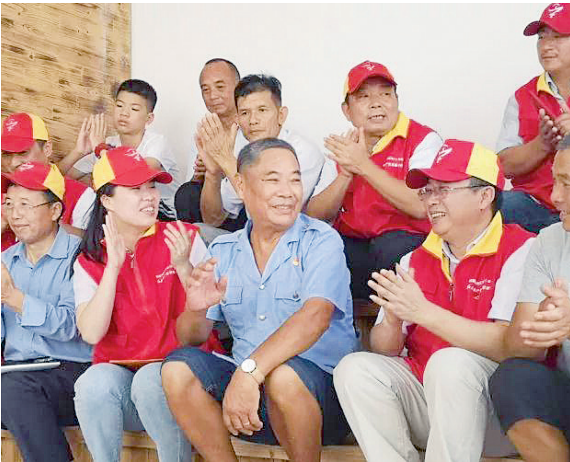
红色网格员分享智慧化服务经验

网格。 点进“金东红网”小程序,有红色代办申请、纠纷调解申请、群众查看反馈等内容。红色网格员扫软数字芯片,可实时打卡走访联系农户情况,直接上报有关事件,并自动连接“金东红网”小程序,形成双向互动机制,让红色网格员履职更到位,群众办事也更方便,从而推进“基层党建+社会治理”网格化、现代化、智慧化。 “没想到不到半小时,红色网格员就上门帮我办领了企业码,真方便!”近日,洋湖塘村一名经营超市的村民点赞道。该村民平时要在店里守门,没有时间出去,听说最近在推广企业码,但他不懂怎么领取,因此就在“金东红网”上把诉求写了上去。自洋湖塘村推行这款小程序后,许多群众体验到了家门口就能办事的“零”跑腿服务。