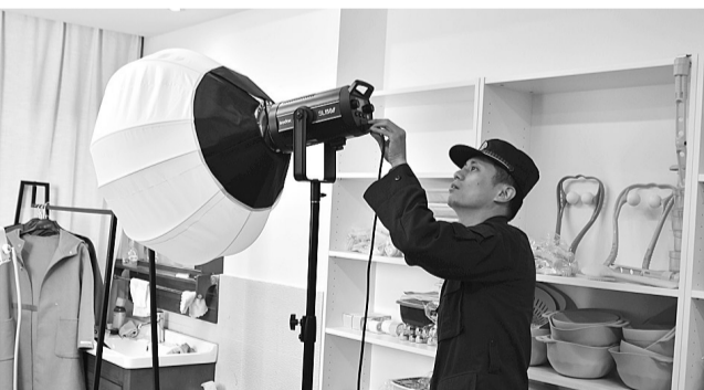
检查现场电气设备