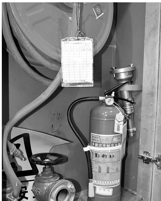
消防巡查日志不符合规范

随后,消防检查人员又依次对现场所有直播间进行了检查,发现上述问题普遍存在,除此之外,现场还