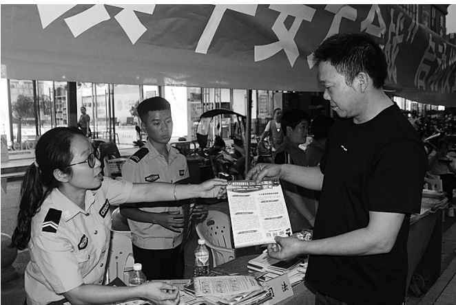
平安志愿者开展平安宣传