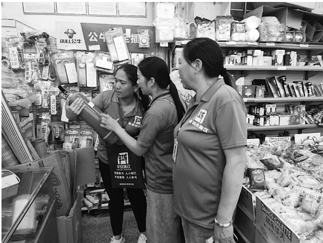
网格员排查安全隐患