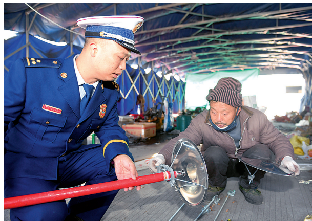
消防人员要求工人对喷淋设施严格把关