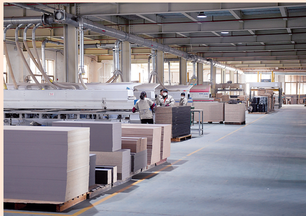
整治后:厂区内整洁有序