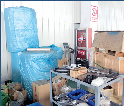
整治前:消火栓箱被违规遮挡