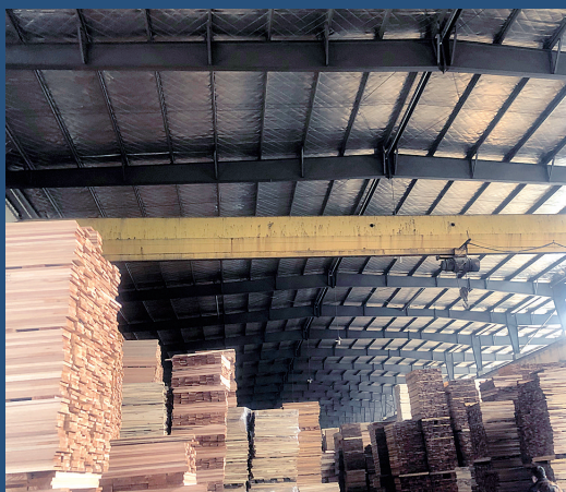
整治前:厂区内消防喷淋设施缺失