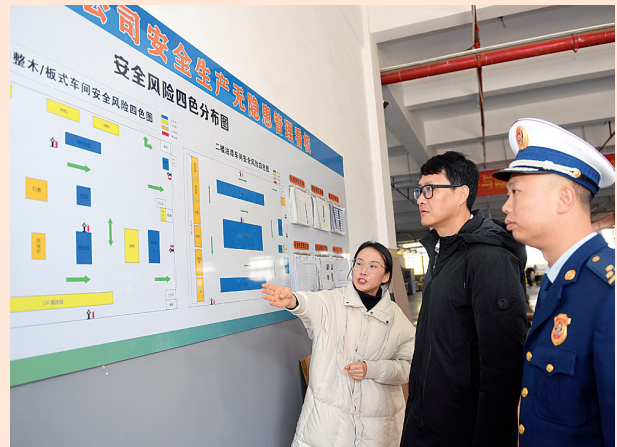
整治后:厂区实行风险四色管理制度