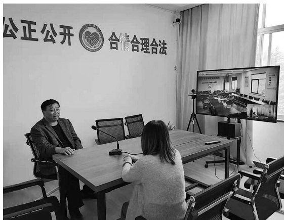
善治示范村,1个全国反邪教先进村。今年11月,大云镇首次获得嘉兴市平安建设突出贡献集体三等功。