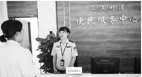
派出所信访接待等服务事项进驻乡镇(街道)矛盾纠纷

“中层队伍平均年龄42岁，队伍年龄断档较为严重，且一批经验丰富的中层干部即将到达退职年限，警力资源