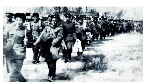
复转官兵挺进北大荒(资料照片)