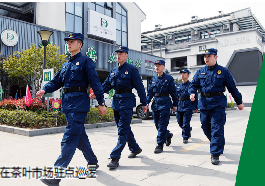
在茶叶市场驻点巡逻