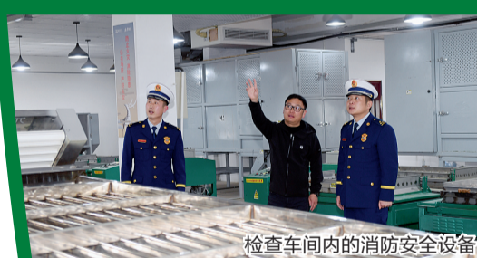
检查车间内的消防安全设备