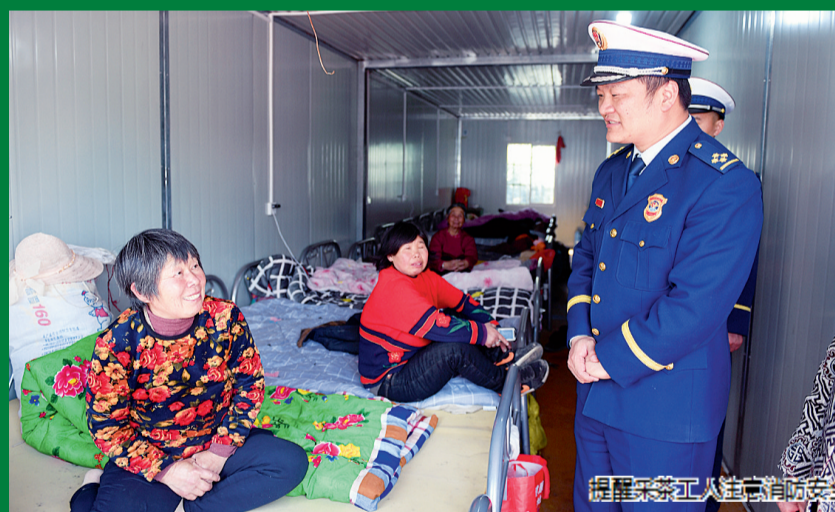
提醒采茶工人注意消防安全