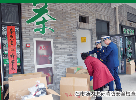
在市场内进行消防安全检查