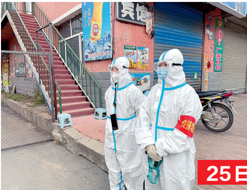
23日，巴彦县兴隆镇一处核酸检测点排队的居民 24日，巴彦县县城一家超市内，市民在选购商品 25日，巴彦县兴隆镇，小区门口值守的防疫工作人员