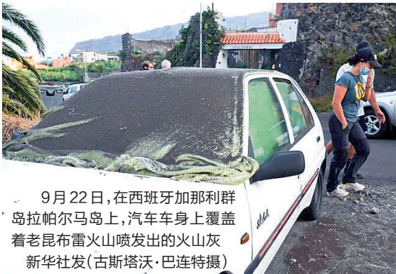
9月22日，在西班牙加那利群岛拉帕尔马岛上，汽车车身上覆盖着老昆布雷火山喷发出的火山灰

据西班牙电视台报道，当地时间9月19日15时12分，拉帕尔马岛老昆布雷火山发生喷发。火山喷发前几个小时，当地曾发生4.2级浅表地震。 拉帕尔马岛是一座火山岛，位于西班牙加那利群岛西北部，面积708平方公里，人口约8.3万。该岛有记录以来曾发生过7次火山喷发，上次火山喷发发生在1971年。 截至24日，火山仍在持续喷发。当天，该火山又出现了两处新的喷发口。火山喷发产生的灰色烟柱直冲云霄，甚至在200多公里远的特内里费岛(加那利群岛中面积最大的岛屿)都能看到。 目前，熔岩已摧毁了400多所房屋，覆盖面积超过180公顷，深度达15米，超过6000名居民被疏散。受火山灰及烟雾影响，拉帕尔马岛机场的全部航班已经取消。