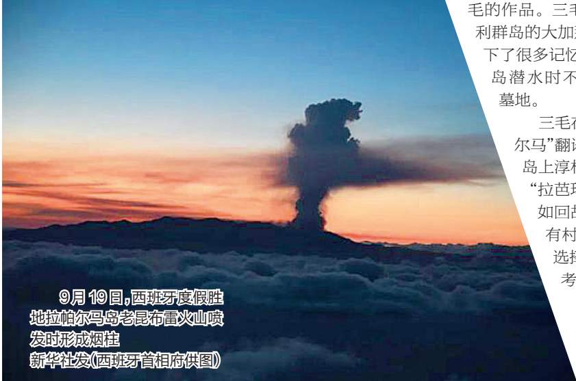
9月19日，西班牙度假胜地拉帕尔马岛老昆布雷火山喷发时形成烟柱