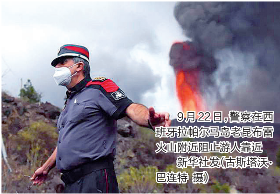
9月22日，警察在西班牙拉帕尔马岛老昆布雷火山附近阻止游人靠近