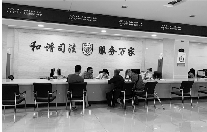
为残疾人提供法律援助

“我市司法行政工作始终坚持以人民为中心的根本立场,着力化解群众反映强烈的法治热点、难点和痛点。”温州市司法局相关负责人介绍,自9月开展“让群众打得起官司”爱民实践活动以来,温州司法行政系统深化公共法律服务体系建设,切实加强矛盾纠纷化解,推进普法与依法治理走深走实,不断提升人民群众法治获得感、幸福感和安全感。