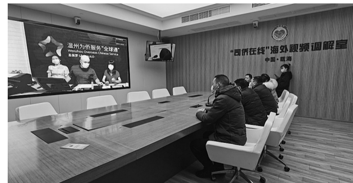
“司侨在线”调解现场

做法管不管用,数据最有说服力。到目前,温州全市已调处纠纷70842件,协议总金额26.45亿元,其中疑难复杂纠纷16137件,调处成功70643件,成功率达99.72%。