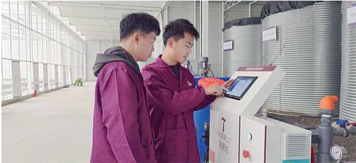
2022年1月5日，水木蔬菜工厂工作人员在查看、操作施肥机。