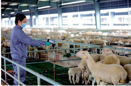
2021年11月16日，工作人员在园区内对湖羊进行巡检。（采访对象供图）

2022年1月4日，湖州市开出第二批“共富班车”项目，项目涉及“乡村畅行”“才聚基层”“清亲好水”“村游富农”“送气下乡”“千兆进村”，更多的小个体”将迸发出“大能量”。