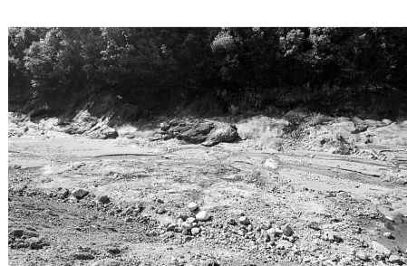
松干溪被挖得满目疮痍