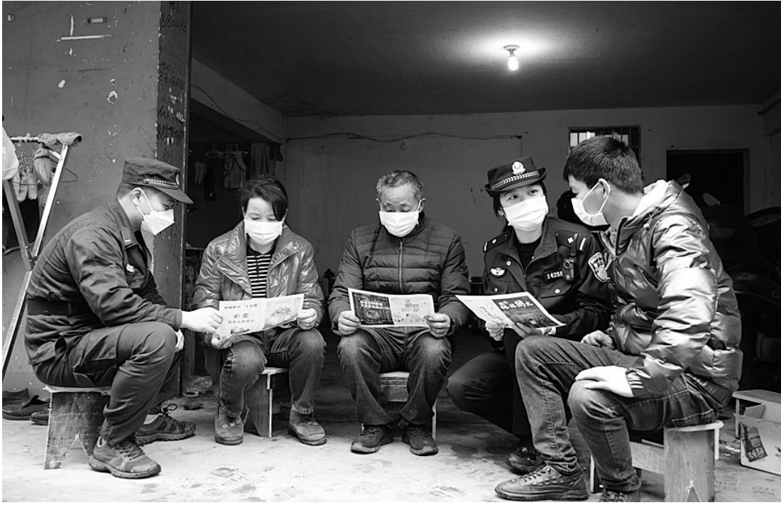
清明临近,3月31日,诸暨市公安局陶朱派出所联合市飞虎森林消防队进村入户,宣传森林防火知识,倡议市民文明祭祀、绿色祭祀。