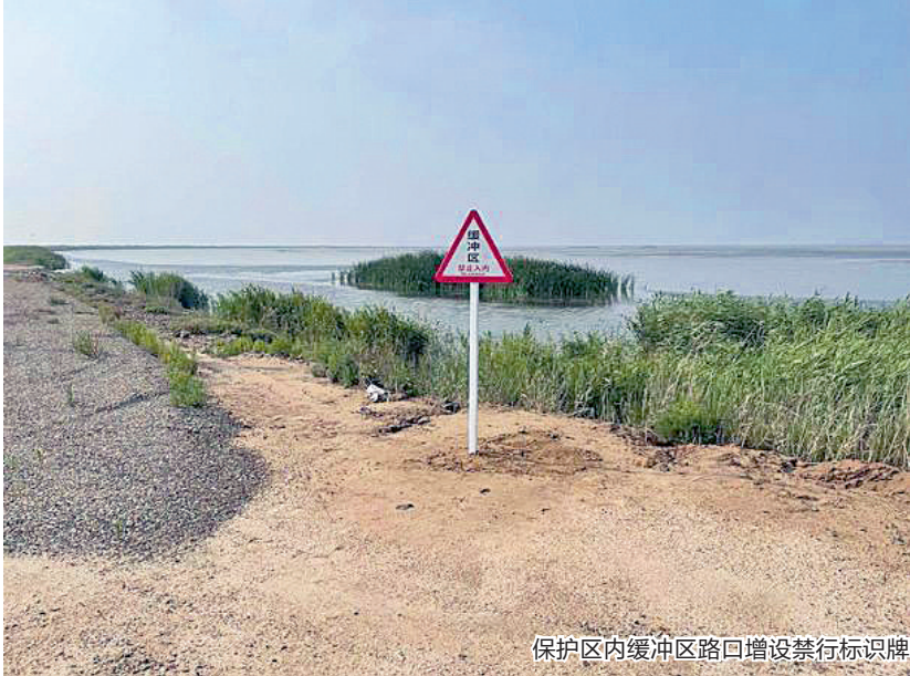
保护区内缓冲区路口增设禁行标识牌