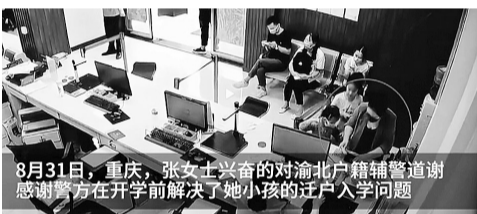
8月31日,重庆,张女士兴奋的对渝北户籍辅警道谢,感谢警方在开学前解决了她小孩的迁户入学问题

“不能让灭火英雄既流血又流泪。”8月31日,重庆。张女士的儿子户口在四川老家,由于其丈夫前段时间前去北碚当灭火志愿者,错过了为孩子上学迁户重庆的时间。渝北警方了解情况后,为张女士一家开通绿色通道,仅2个工作日就完成了迁户事宜,赶在孩子开学前解决了问题。