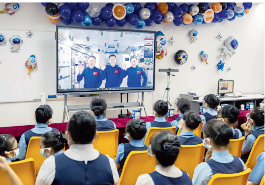
11月1日,马来西亚吉隆坡中国公学的学生参加“天宫对话”活动。