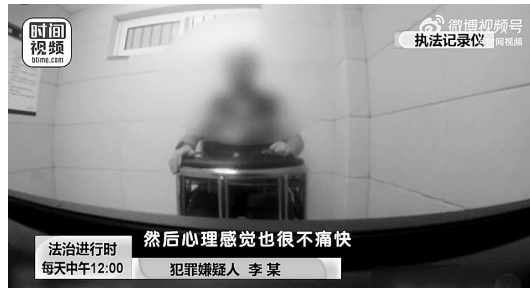
然后心理感觉也很不痛快 犯罪嫌疑人 李某 每天中午12:00

此前,北京的李某在网上购买了一台价值1.8万余元的电脑,他想要快递员把电脑送到自己手中。但快递员最终还是把电脑放到了代收点,并扔在角落里。李某取电脑时非常生气,为报复快递员,谎称未取到,并申请了平台退款。快递员报警,民警很快将李某抓获。近日,李某被判处拘役6个月,缓刑6个月,并罚款5000元。