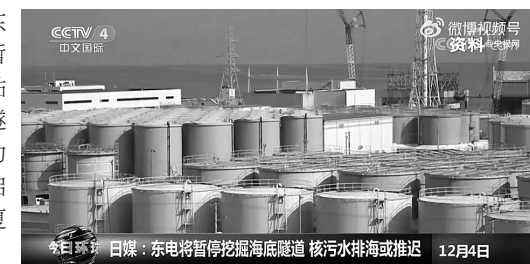
日媒:东电将暂停挖掘海底隧道 核污水排海或推迟 12月4日

据日本媒体报道,东京电力公司将近期暂停挖掘福岛第一核电站核污水排海用的海底隧道。日本政府和东电力争的“明年春季前后”启动排海,很可能推迟至夏季以后。