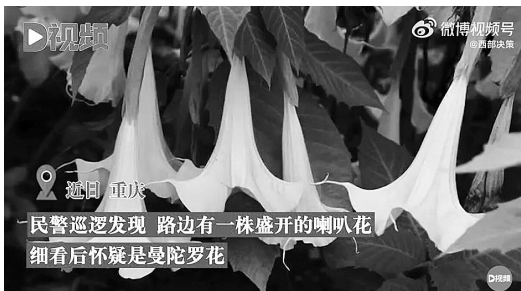
民警巡逻发现 路边有一株盛开的喇叭花 细看后怀疑是曼陀罗花