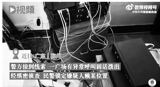
警方接到线索 一广场有异常呼叫固话拨出 经缜密侦查 民警锁定嫌疑人赖某位置

近日,广东梅州,警方接到线索,一广场有异常呼叫固话拨出,民警侦查后将嫌疑人赖某抓获。赖某交代,因手头紧从网上找了上线,对方答应每天给1300元报酬。赖某按照对方的指示,准备了虚假营业执照、设备和场地,并以企业的名义注册开通了20个固话号码,架设“商继通”帮境外诈骗分子实施诈骗。目前,赖某已被依法采取刑事强制措施。