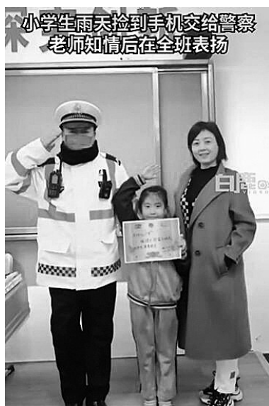
小学生雨天捡到手机交给警察 老师知情后在全班表扬

近日,陕西西安,一小女孩在雨天里捡到手机立即交给附近交警。交警介绍说,这名小女孩是西安理工大学附属小学二年级的学生,当时是一个雨天,天已经黑了,小朋友捡到的是一个价值六七千元的手机,她立即交给了在附近执勤的交警,后续失主也来认领了手机,并表示了感谢。为了进一步表扬小女孩,交警将此事告知了小女孩的学校,班主任知道后也给小女孩颁发了奖状,并在全班同学面前表扬。交警说,孩子获奖后也很高兴,这是能影响孩子一生的。