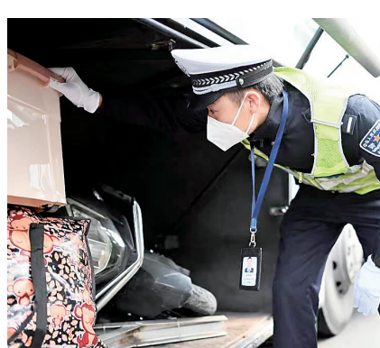
宁波交警检查车辆安全