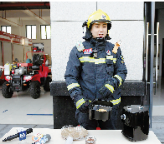
将装有面饼的塑料打包盒放入空气炸锅