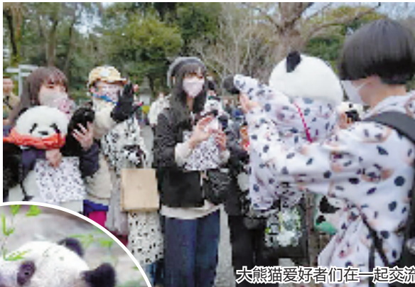
大熊猫爱好者们在一起交流

距离上野动物园不远,日本百货公司松坂屋二层的一角正在举办熊猫摄影家、“每日熊猫”博客博主高氏贵博的“香香”摄影展。从10万张照片中精选出的920张照片,记录了2017年12月19日至2022年11月27日期间他与“香香”