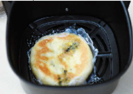
塑料打包盒已完全熔化

消防员将一个装有面饼的塑料打包盒放入空气炸锅,按照空气炸锅使用流程,先把温度设置到200度,再设置好一定的时间,然后开始加热。 “糊了,糊了!”才刚过1分钟,记者就在现场闻到了浓浓的塑料烧焦的味道。消防员立即停止加热,将锅底从底部抽出,发现原本盛着面饼的打包盒已经完全熔化,粘在了锅底上,散发出难闻的气温。