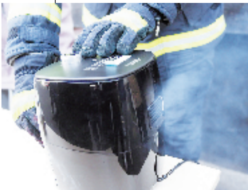
空气炸锅出风口冒出青烟

清理好锅底熔化的塑料,又将加热管和锅底之间的隔层保护取走,消防员把一张常用的油纸放入空气炸锅,然后把一个小馒头放到油纸上,接着启动空气炸锅,进行加热。 与前一次实验“坚持”了1分钟不同,这次加热才刚刚开始,空气炸锅的出风口就冒出了青烟,少量火星飞出。