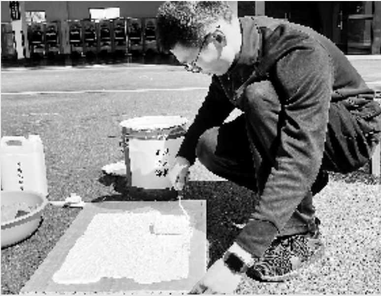
给木板涂上防火涂料

近日,海盐县消防救援大队从正规渠道采购防火涂料、防火阻燃液,并从网上购买不合格防火阻燃液,就防火性能等展开测试。