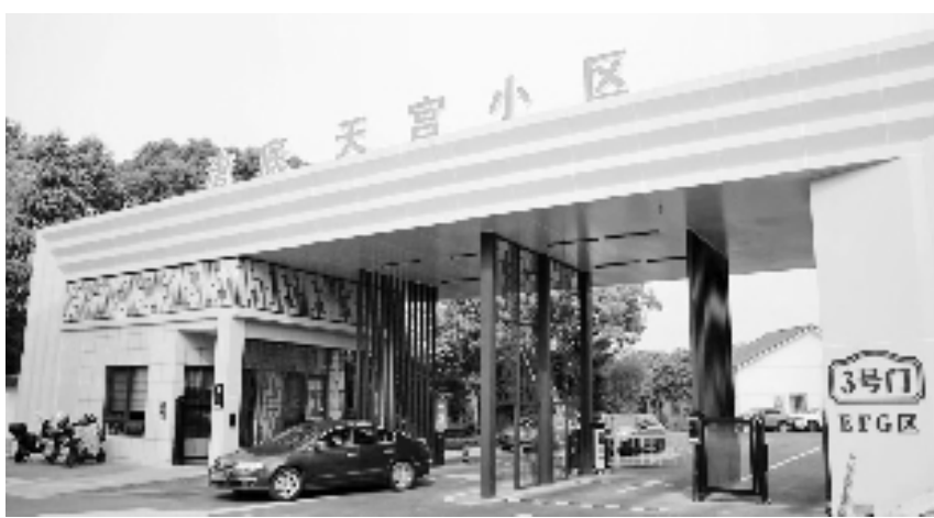
村民住进了都市化小区