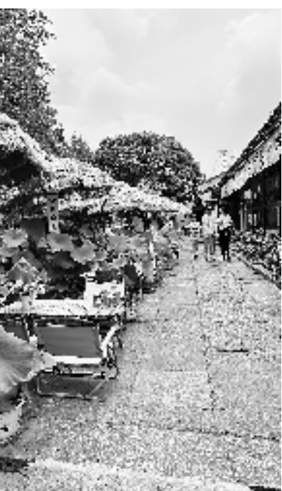
西江古村如今成了网红景点