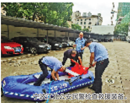
宁波江北公安民警检查救援装备。

平阳县青街乡有位八旬瘫痪老人被困家中,南雁派出所民警将老人转移至安全地带;顺溪水库开闸放水,顺溪派出所民辅警马不停蹄奔走,全天候转移受困群众;鳌江