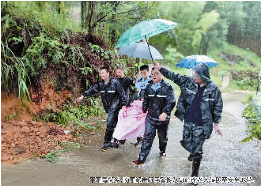
平阳青街乡,南雁派出所民警将八旬瘫痪老人转移至安全地带。

镇墨城社区海边,滨江派出所民辅警紧急撤离滞留群众……平阳公安安全警动员,全面落实防台防汛应急处置预案,严密24小时值守,做好应急救援准备,采取屯兵街面、叠加