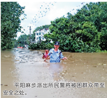
平阳麻步派出所民警将被困群众带至安全之处。

镇墨城社区海边,滨江派出所民辅警紧急撤离滞留群众……平阳公安安全警动员,全面落实防台防汛应急处置预案,严密24小时值守,做好应急救援准备,采取屯兵街面、叠加